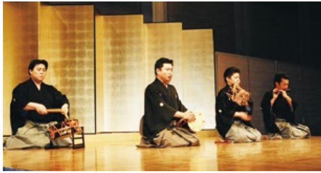
紅梅会総会で開催した能楽教室

紅梅会はホテルニューオータニ博多で開催しました。在福の同級生を中心に県外に住んでいる同級生にも協力してもらいながら、皆で協力してやり遂げた！という思い出です。