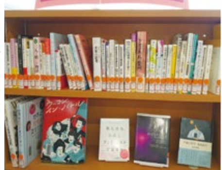
新設された紅梅会推薦図書のコーナー

ライナ侵攻など不透明な社会情勢の中で、今後、世の中はどう変わるのだろうか。私はどう生きようか」「私らしい人生を歩みたい」と、