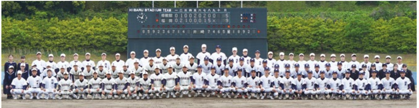
記念試合を終えた修猷館と福高の野球部員ら

昨秋の九州大会予選での県大会出場(県ベスト8)に続き、春の九州大会予選でもベスト8に入り、2大会連続での県大会出場となりました。県大会をかけた5回戦・福工大城東との試合では、5回終わって1-4とリードされた展開でしたが、最後まで諦めないというチームの持ち味を発揮して最終的に6-5で競り勝つことができました。 ただ、次の準々決勝・東海大福岡との試合では、力の差を感じさせられる内容(2-11※7回コールド負け)でした。この大会では、チームの目標として九州大会出場(福岡から2校出場)を掲げていただけに、大変悔しい結果となってしまいました。 昨秋も九国大付に対して完敗、この春も東海大福岡に完敗と、ベスト4の分厚い壁にぶつかっています。さらに上に上がっていくためには、まず何が