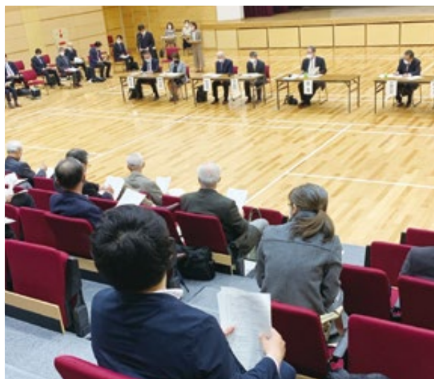
記念講堂で開かれた常任幹事会

発行 福中・福高同窓会広報委員会 〒812-0043 福岡市博多区堅粕1-29-1 電話092-641-7258 https://fukuchu-fukkou.jp/