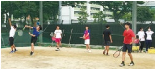
練習に励むソフトテニス部員

ソフトテニス部が使用しているテニスコートには、以前は十分な照明がありませんでした。日没が早い時期はラケットやボールを使った練習ができる時間